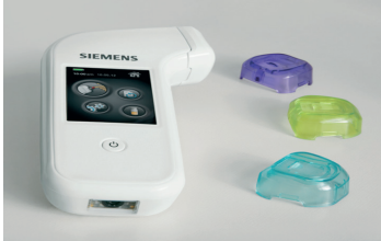
Xprecia Stride™ Gerinnungsmonitor